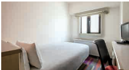
シングル 10~11㎡ 20室 (3~11階)