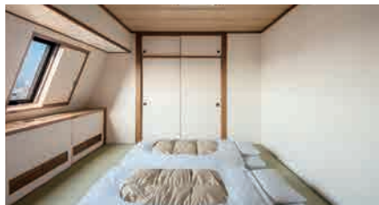
和室 23、32㎡ 2室 (12階)