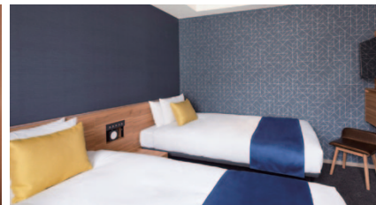
ツイン 14~27㎡ 36室 (2~8階)

2019年11月にニューアルオープンを果たし、より快適に過ごしていただける空間に生まれ変わりました。「赤坂見附駅」から徒歩1分に位置する「the b 赤坂見附」は、他に類を見ないほど、東京の主要エリアへのアクセスに優れています。「銀座」「浅草」「渋谷」「新宿」へのアクセスは電車1本、路線をひとつ乗り継げば、東京ディズニーランド、東京ビッグサイト、高尾山までも、簡単に移動できる最高のロケーション。