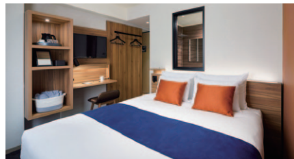
ダブル 12~16㎡ 67室 (2~8階)