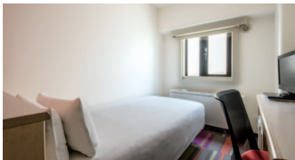
シングル 10~11㎡ 20室（3~11階）