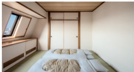
和室 23、32㎡ 2室（12階）